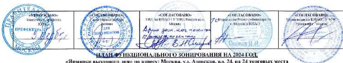
ПЛАН ФУНКЦИОНАЛЬНОГО ЗОНИРОВАНИЯ НА 2024 ГОД «Ярмарки выходного дня» по адресу: Москва, ул. Азовская, вл. 24, на 24 торговых места Режим работы: пятница, суббота, воскресенье