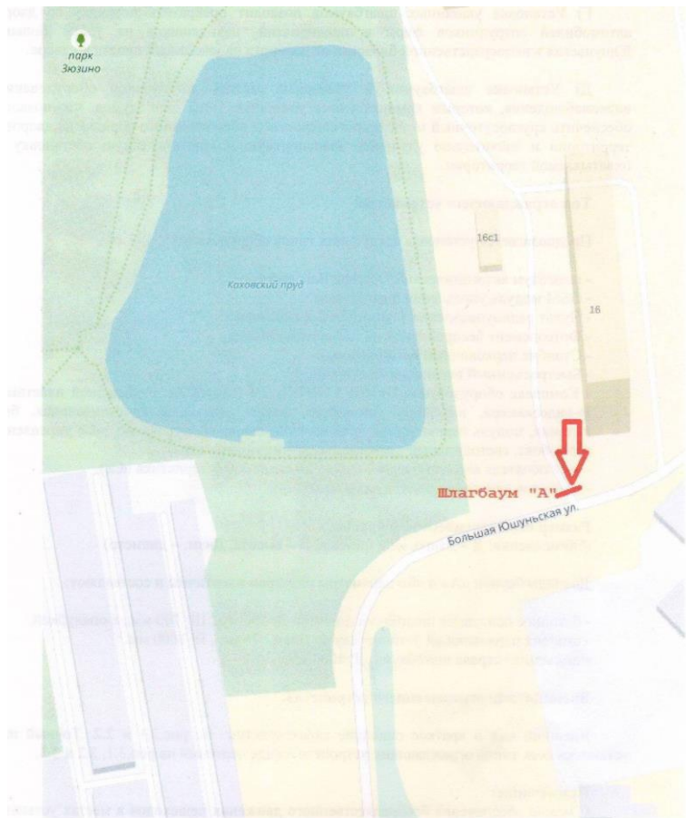
Рис.1.1 – место установки шлагбаума «А»