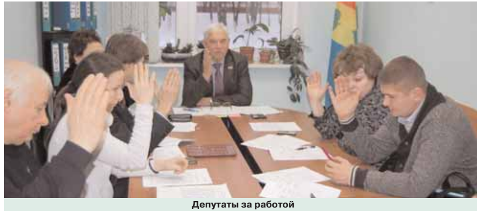
Депутаты за работой

организован призывной пункт при объединенном отделе военного комиссариата г. Москвы по академическому району (ул. Дмитрия Ульянова, д. 14, корп. 5), а